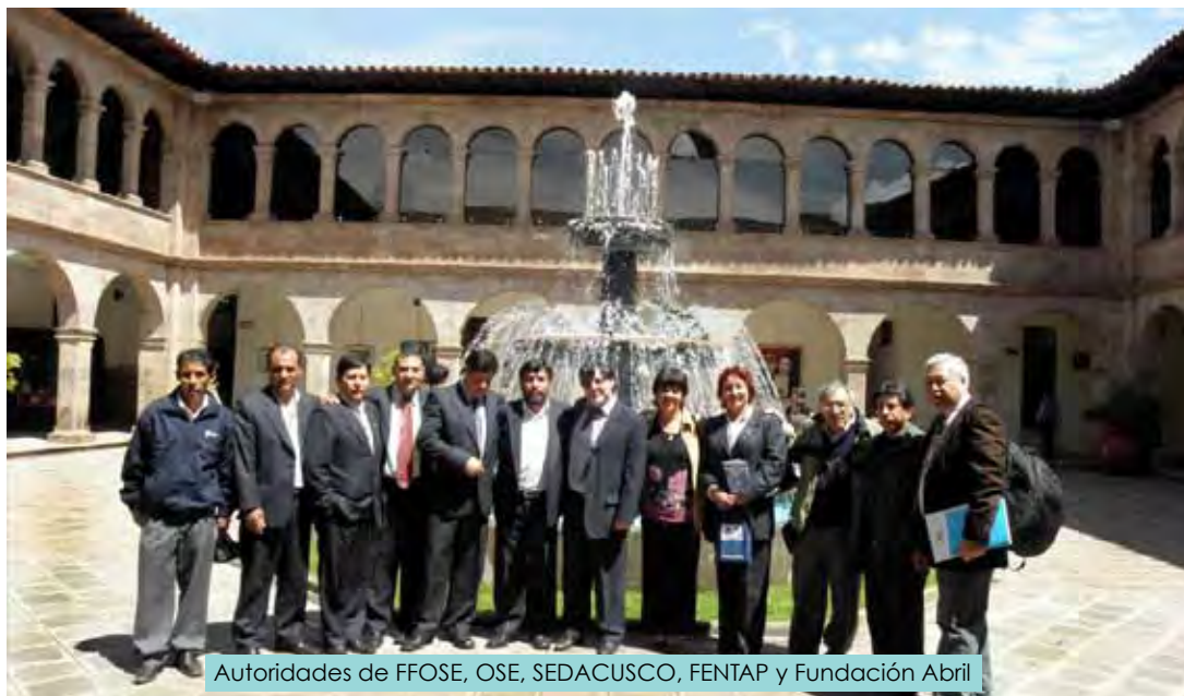
Autoridades de FFOSE, OSE, SEDACUSCO, FENTAP y Fundación Abril